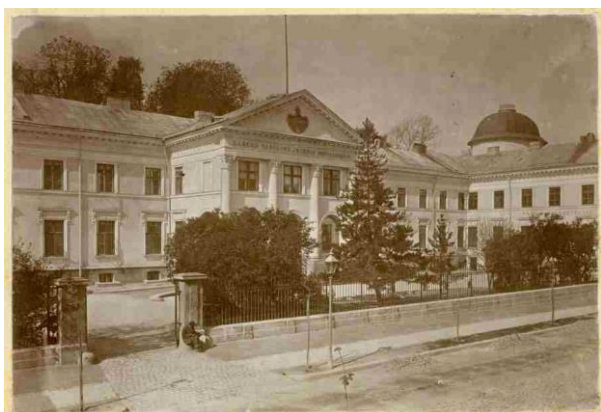
Zakład Narodowy im. Ossolińskich we Lwowie

Polecenie: Zapoznajcie się uważnie z informacjami